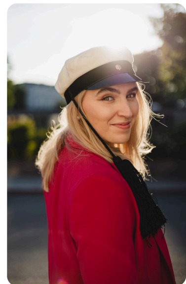
Kuva: Kia Finska

Aiemmat vertaisarvioidut tutkimukset ovat keskittyneet pitkälti sosiaalisen median palveluiden loppukäyttäjien turvallisuuteen, eivätkä niinkään sisältöjä tuottavien tahojen tietoturvaan. Tutkimuksen ainutlaatuisuudesta kertoo se, että alan konferensseissa asiantuntijatkin ovat todenneet aiheen olevan poikkeuksellisen mielenkiintoinen ja tarpeellinen.